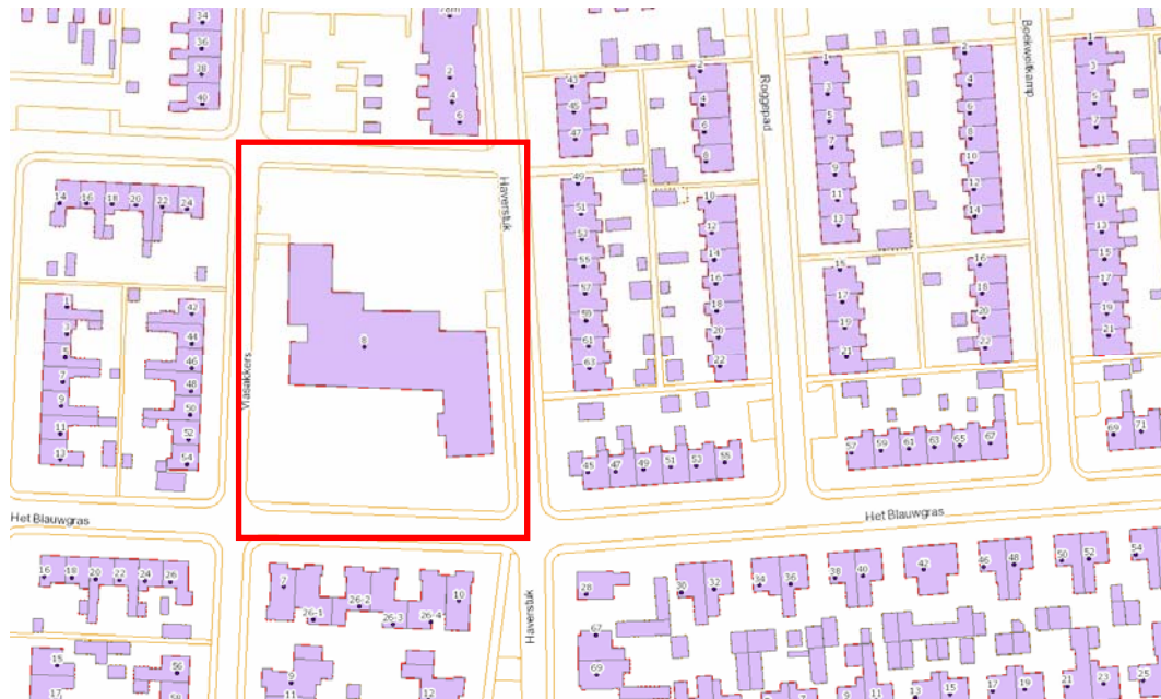
Afbeelding 1: Plangebied

Het plangebied ligt in de wijk De Bouwen in Drachten.