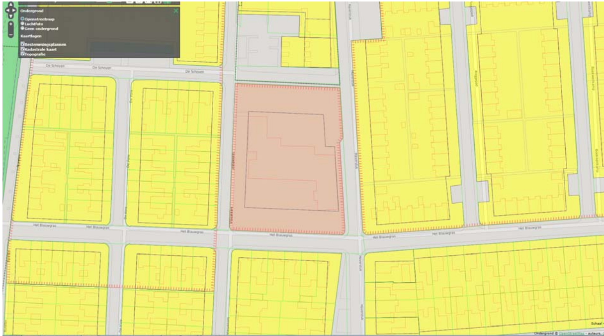
Afbeelding 4: Fragment plankaart

Het bouwplan gaat echter uit van 22 woningen.