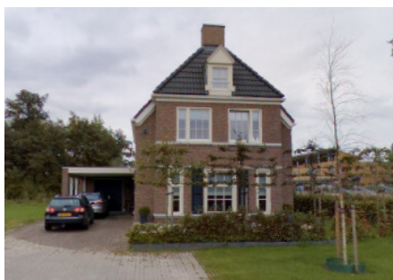
voorbeeld vrijstaand woning