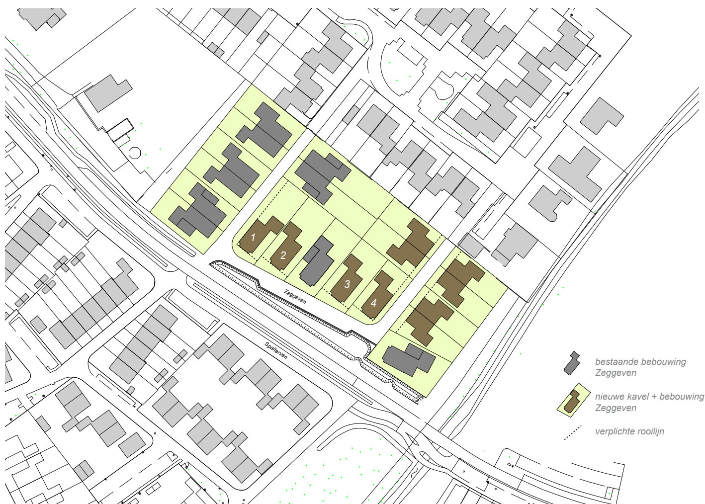
een voorbeeld van een flexibele verkaveling, drie vrijstaande woningen en acht tweekappers

Zodoende kunnen maximaal 10 nieuwe woningen worden toegevoegd.