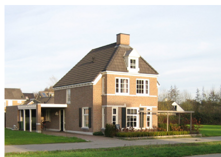
schilddak met hoge en lage goot