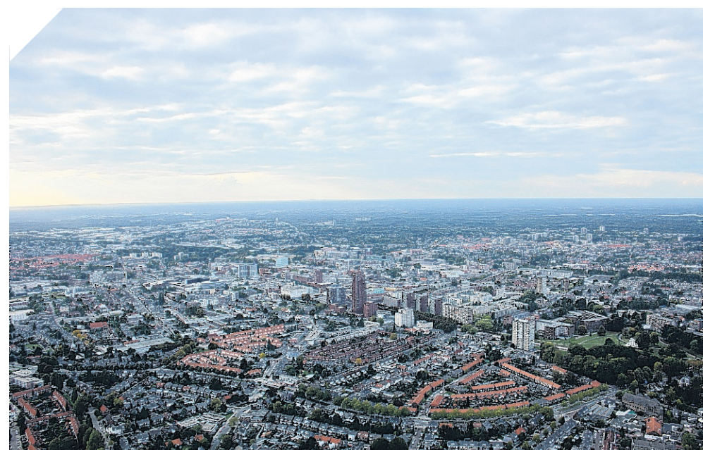
Erkenning van een wijk- of dorpsraad betekent dat de gemeente ze als aanspreekpunt van de bewoners in hun gebied erkent. Bijvoorbeeld wanneer er besluiten moeten worden genomen.

Power Royael is gevestigd aan de Wethouder Gerbertstraat 10 en is geopend van maandag t/m vrijdag van 9.00 – 16.00 uur. U kunt ook bellen naar 053 4764743.