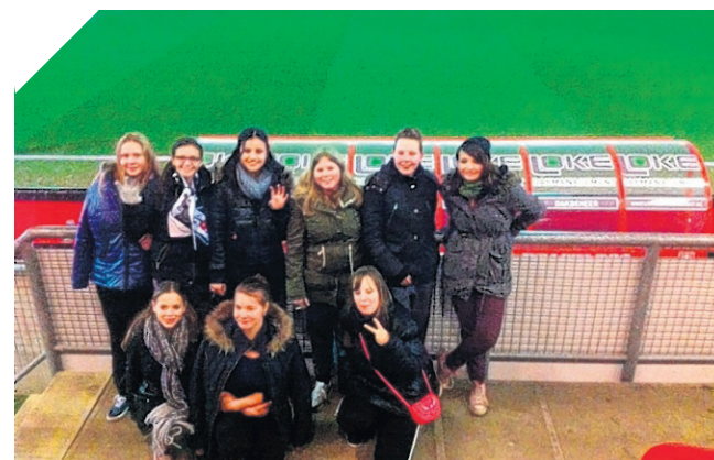
Elke woensdagavond doen de meiden van FC Pathmos mee aan de sportactiviteit van Alifa in de Boei

De FC Twente Cup is een uniek project waarbij teams zich kwalificeren voor het voetbaltoernooi om de FC Twente Cup. De deelnemers kwalificeren zich door trainingen, oefenwedstrijden en buurtbijdrages in de eigen wijk. Voor de prestaties ontvangen ze mooie FC Twente prijzen! Alle teams die 250 punten of meer verzamelen kwalificeren zich voor het eindtoernooi op het trainingscomplex van FC Twente in juni (Twentecup, 2014). Ook uit de wijk Pathmos doet een groep van 10 fanatieke meiden mee. Elke woensdagavond wordt er een sportactiviteit aangeboden in de Boei door Alifa waar deze groep aan deelneemt. Het FC Pathmos