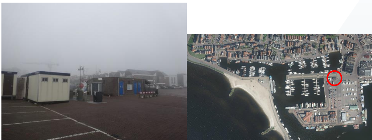
Figuur 2 locatie infocentrum

Zowel het toeristeninformatiecentrum, in het vervolg afgekort tot infocentrum, als de strandkiosk zijn bedoeld voor de recreanten; de strandkiosk voor de strandbezoekers (verkoop strandartikelen en van warme en koude snacks, frisdrank, warme dranken en ijs) en aanmerende schepen (douche- en toiletgebouw); het infocentrum voor de auto/bus toeristen (informatiecentrum en toiletgebouw) en aanmerende schepen (balie functie van het havenkantoor, douche- en toiletgebouw). De ontwikkeling van beide gebouwen moet bijdragen aan het oppoetsen van de Parel van Urk. De sobere uitstraling van de