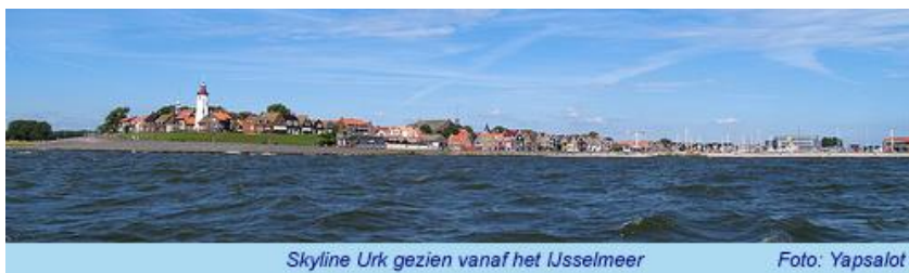
Figuur 3 skyline van Urk, beeldmerk van het eiland

Vanaf het IJsselmeer is Urk herkenbaar door de skyline waarin de vuurtoren en (boten/schepen in) de haven tegen de achtergrond van het oude dorp het beeld bepalen. De hoogteverschillen van het oorspronkelijke eiland (de vuurtoren en omgeving is duidelijk hoger gelegen dan het gebied direct rond de haven) en zowel de kleinschalige als grootschalige havenactiviteiten zijn duidelijk waarneembaar. De ontwikkeling van beide gebouwen moeten passen in deze skyline. Op het schaalniveau van Urk dienen deze beide gebouwen geen nieuw landmark te vormen in deze skyline.