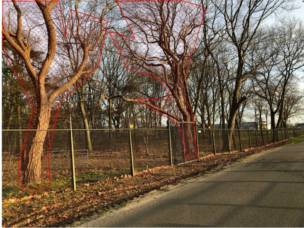
foto's bestaande poort - te kappen bomen aangeduid