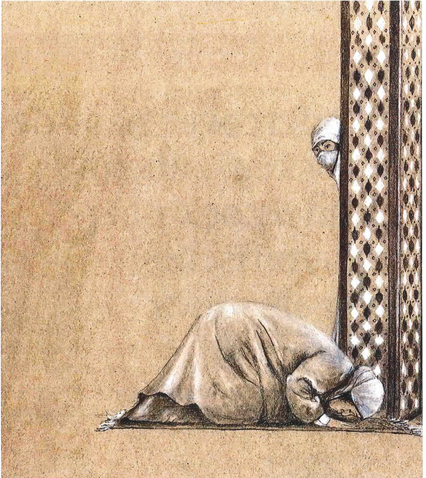
Illustratie Mikko Kuiper