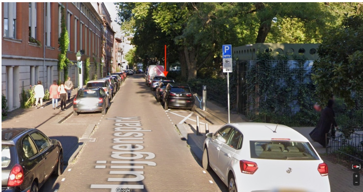
CE-50: Voorgestelde locatie afvalsorteerstraatje Huijgensspark tegenover nr. 30

Onderstaand tref je een afbeelding van de voorgestelde locatie.