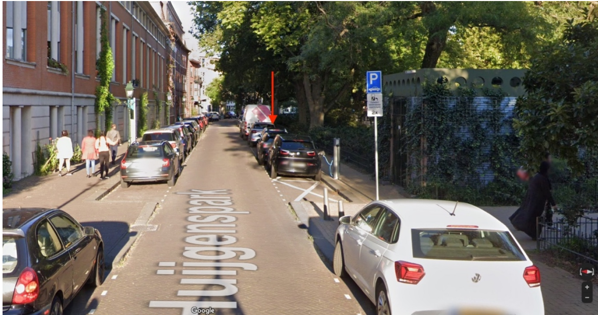
CE-50: Voorgestelde locatie afvalsorteerstraatje Huijgenssprak tegenover nr. 30

Onderstaand tref je een afbeelding van de voorgestelde locatie.