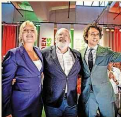
PvdA/GL-trio Attje Kuiken (l.), Frans Timmermans (m.) en Jesse Klaver.