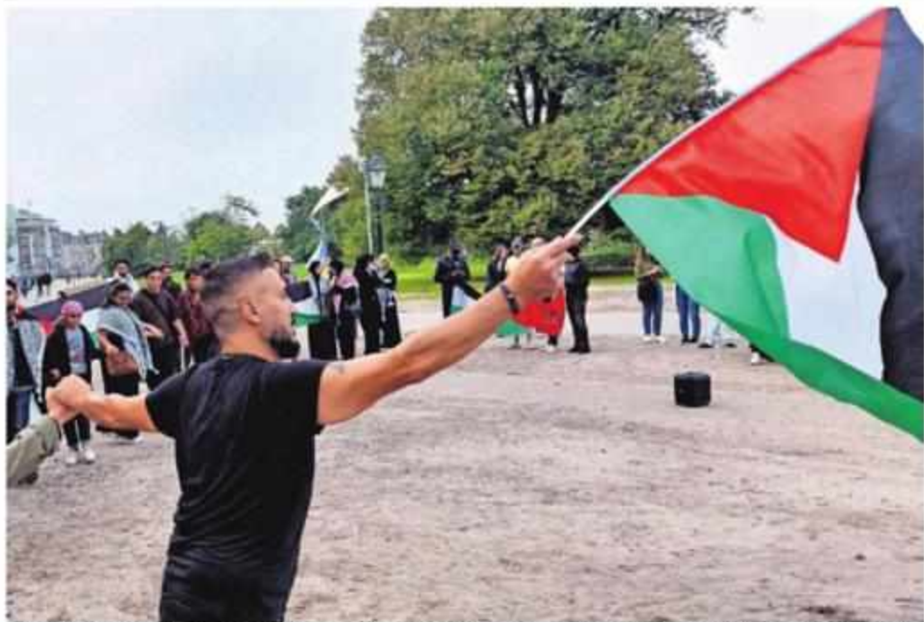
Pro-Palestina demonstranten op de Koekamp zwaaien met de Palestijnse vlag en zingen 'Israel Terror State' en 'From the River to the Sea, Palestine will be free'.

Na twijfel hijst stad geen Israëlische, maar Haagse vlag