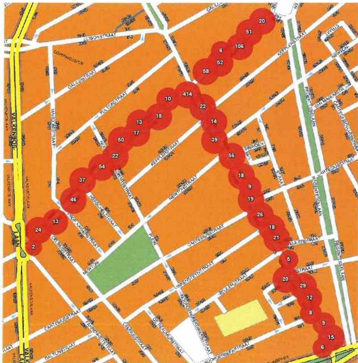
Kaart 1 registraties met huisnummer

In deze periode zijn er 1529 incidenten in het bedrijfsprocessensysteem BVH geregistreerd. In de Weimarstraat zijn 1151 incidenten geregistreerd en op de Beeklaan 378 incidenten. Dit betreft zowel meldingen door burgers als incidenten waarbij de politie op eigen initiatief heeft opgetreden. Hieronder zijn twee kaarten afgebeeld waarop alle registraties van de Weimarstraat en Beeklaan uit de onderzoeksperiode zijn weergegeven. De eerste kaart geeft de registraties weer waarbij in BVH een huisnummer is geregistreerd. De tweede kaart geeft de registraties weer van incidenten waarbij geen huisnummer werd geregistreerd in BVH.