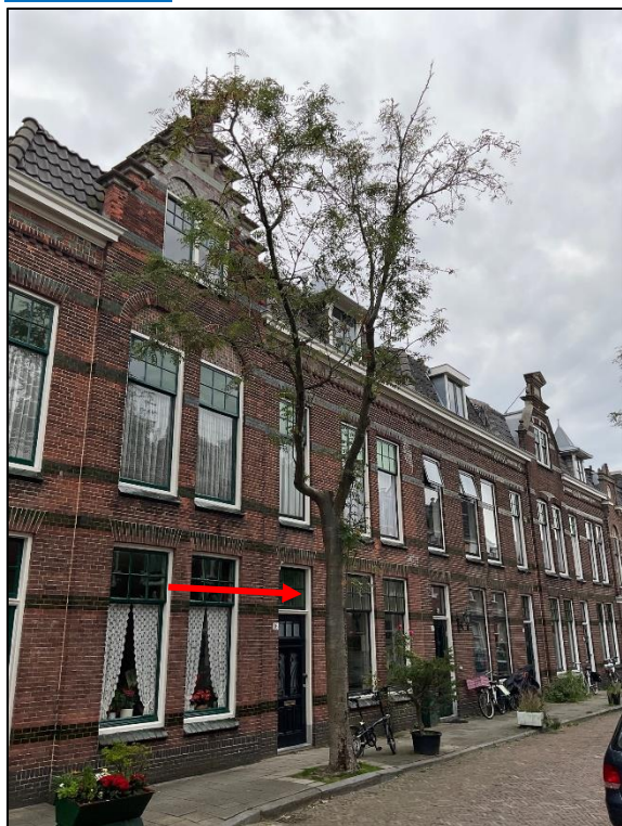
De boom is middels rode pijl gemarkeerd