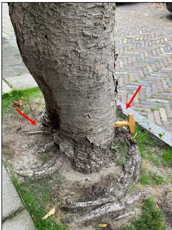
De holte en rotting zijn 'door en door'