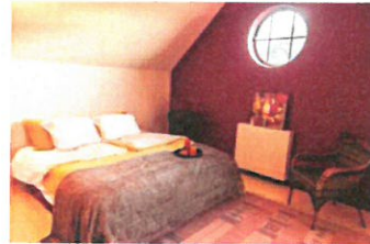
Foto's Galerie en B&B/berging