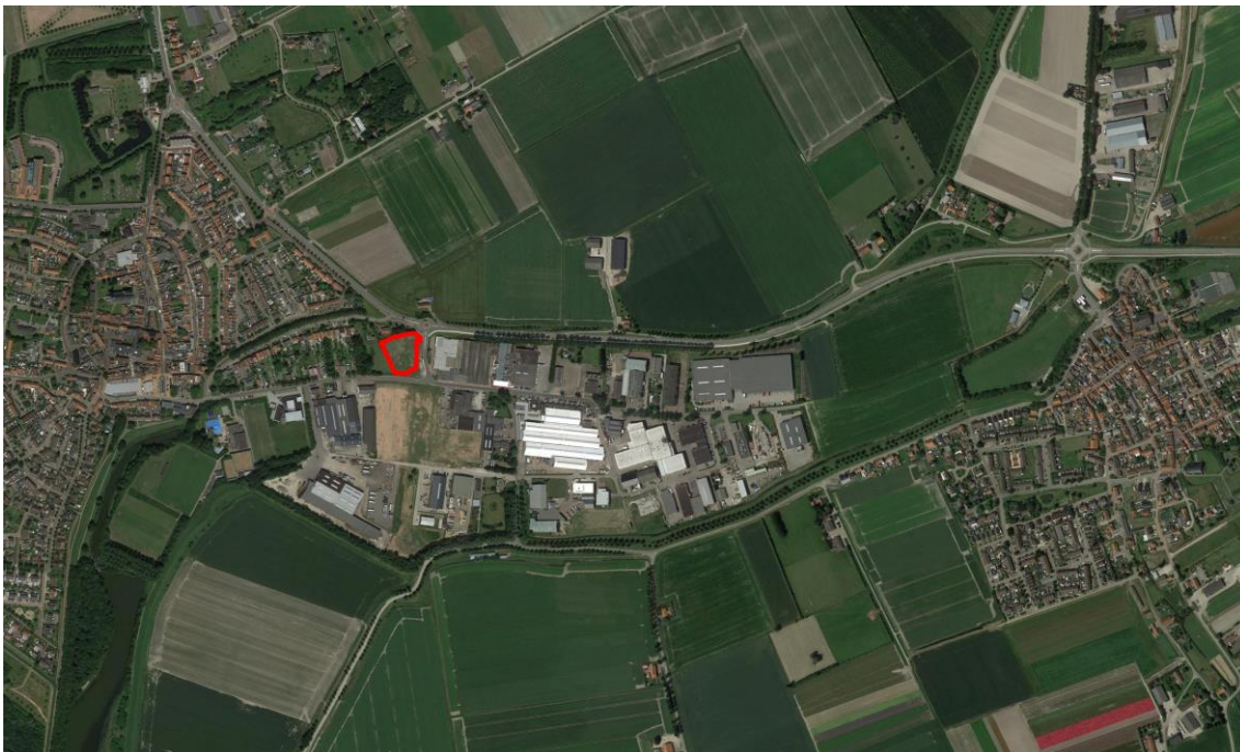
figuur 1.1. Ligging plangebied