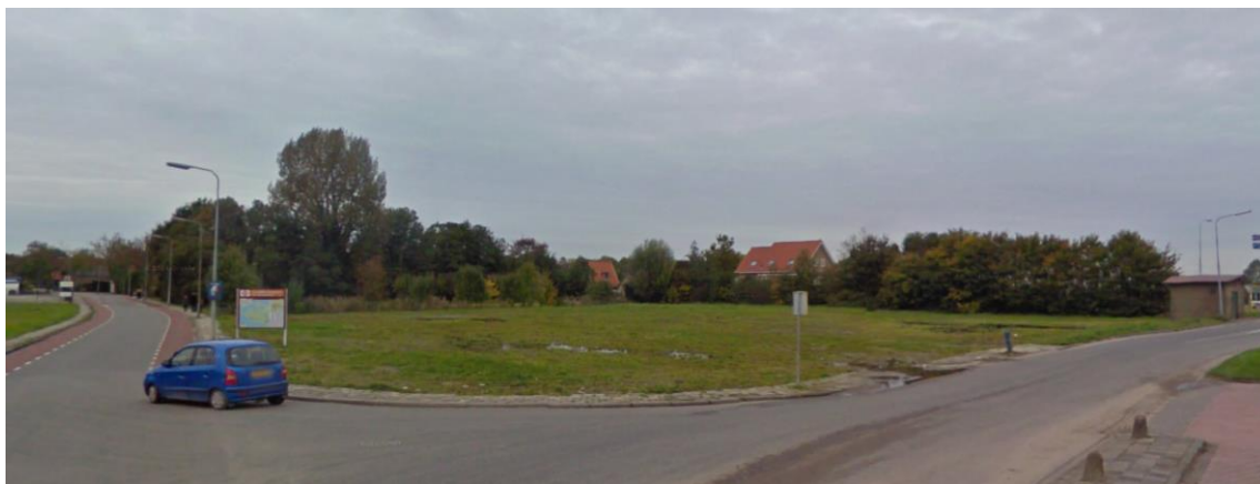
Figuur 1.3 Huidige situatie

Het gehele plangebied kan worden gekenmerkt als grasland/braakliggend terrein (zie figuur 1.3).