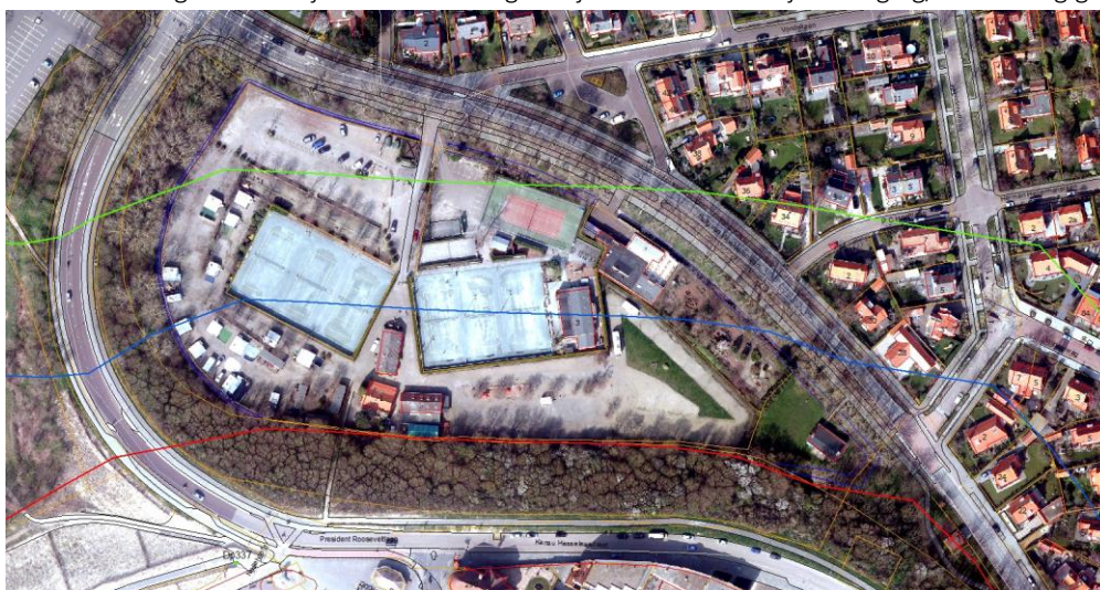
Figuur 2 Situatie primaire waterkering plangebied.

Het project is gelegen in de beschermingszone A en B van de primaire waterkering. Met het waterschap is overeenstemming over het demontabel bouwen van de verblijfsrecreatieve eenheden. Alle onderdelen boven de fundering worden demontabel uitgevoerd. Zowel de fundering als de verticaal opgeslagen heipalen dienen als een versterking van het dijklichaam en mogen bij een eventuele dijkverhoging/versterking gehandhaafd blijven.