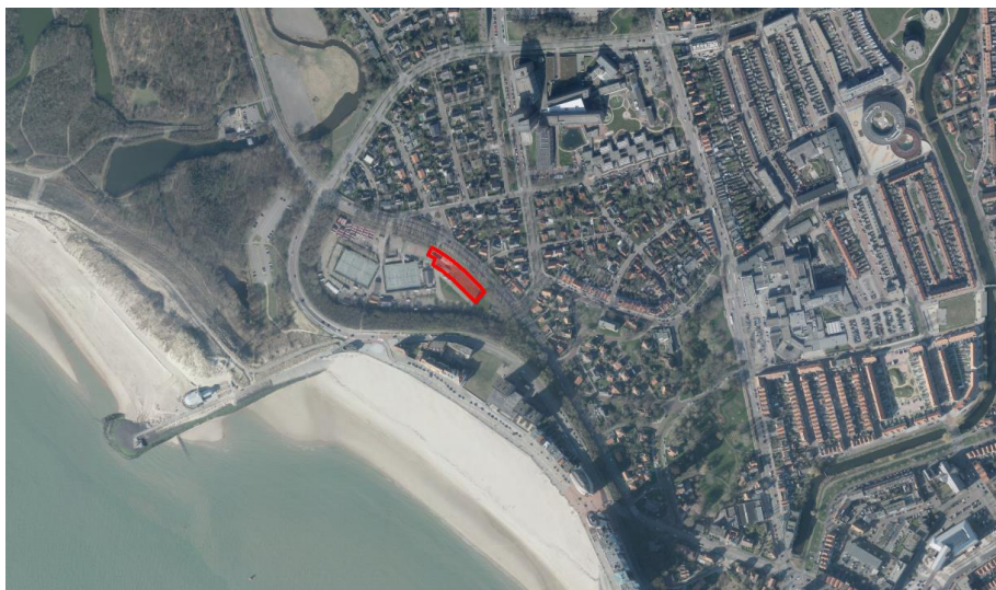
Figuur 1 Ligging en begrenzing projectgebied

Op figuur 1 is de ligging en begrenzing van het projectgebied aangegeven.