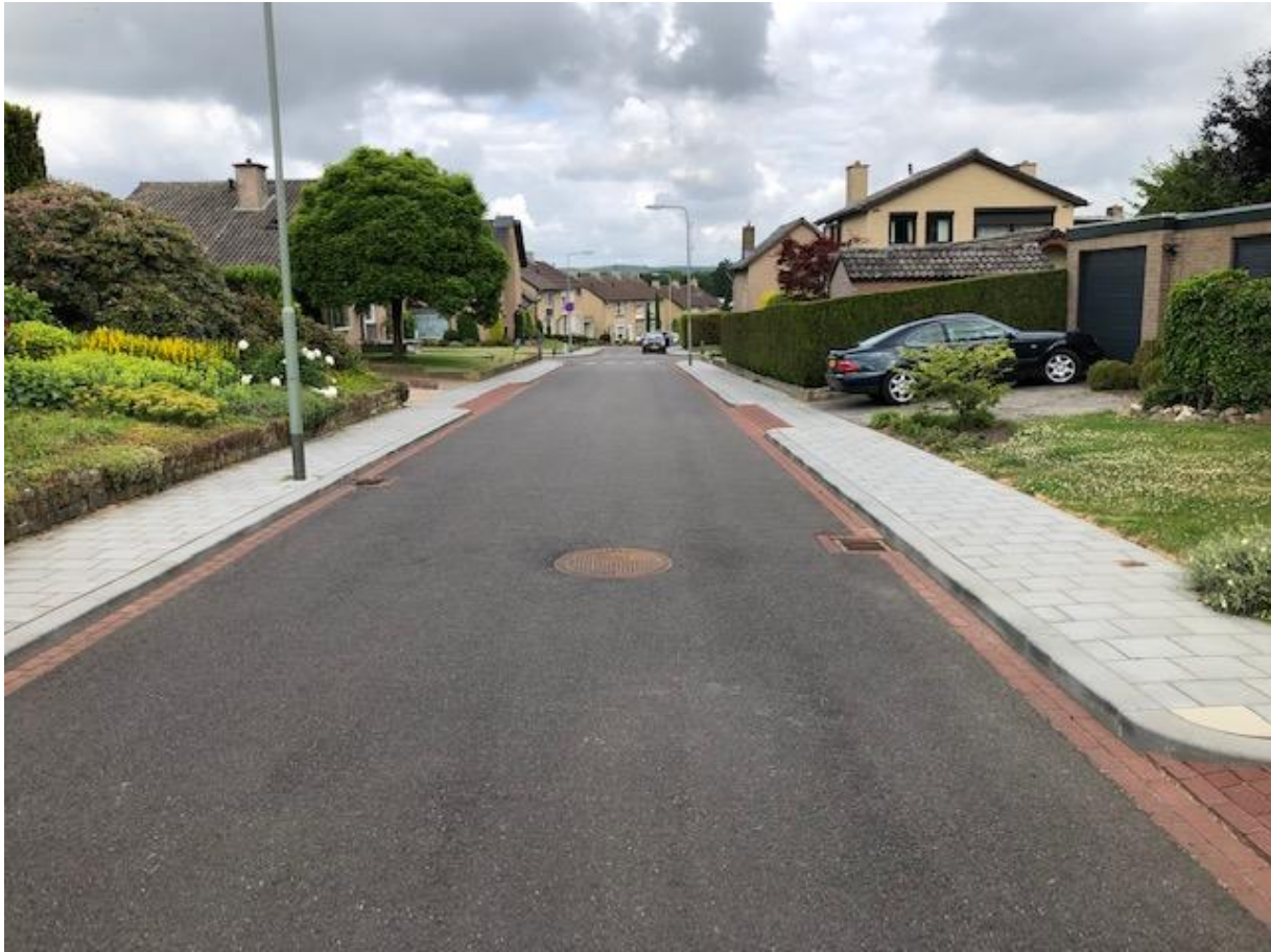
Van Cosselaerstraat Partij