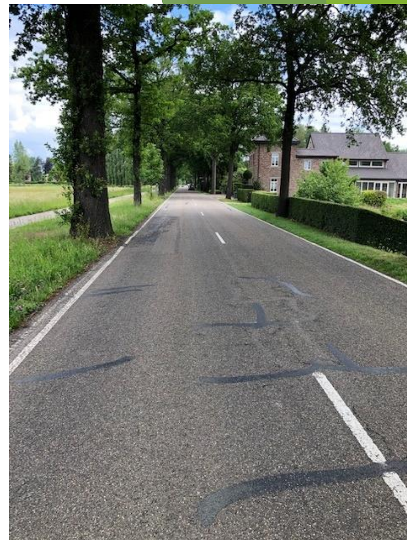
Gulpenerweg tussen Wijlre en Gulpen