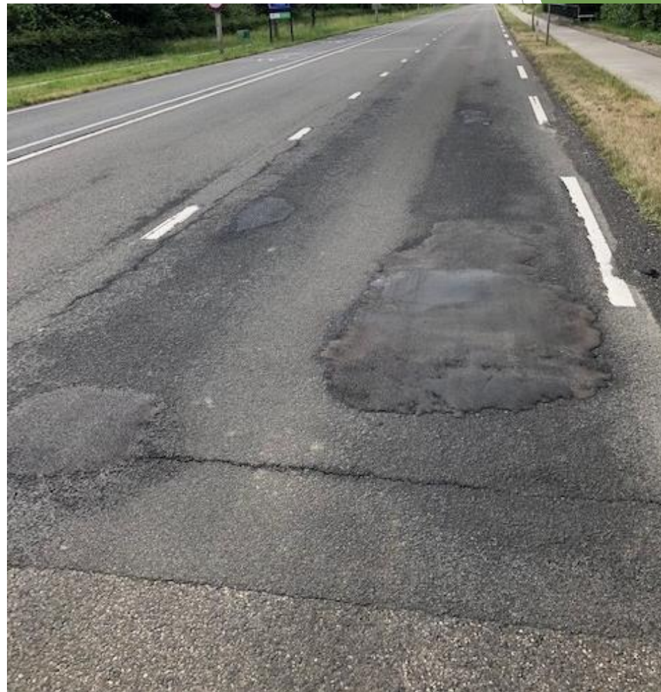
Rijksweg N278 Gulpen