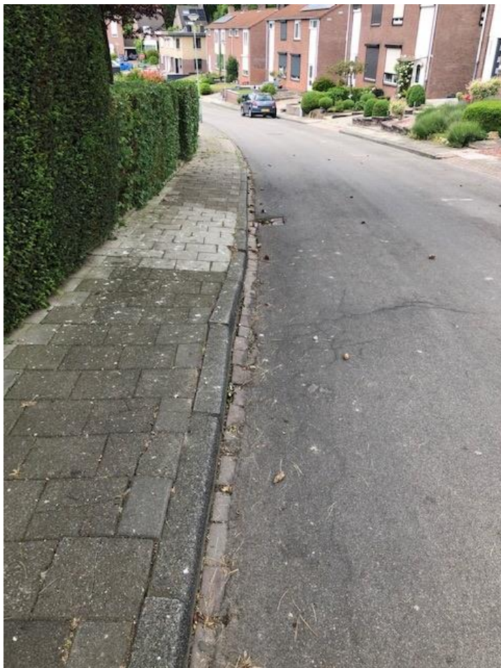
Prins Bernhardstraat Gulpen