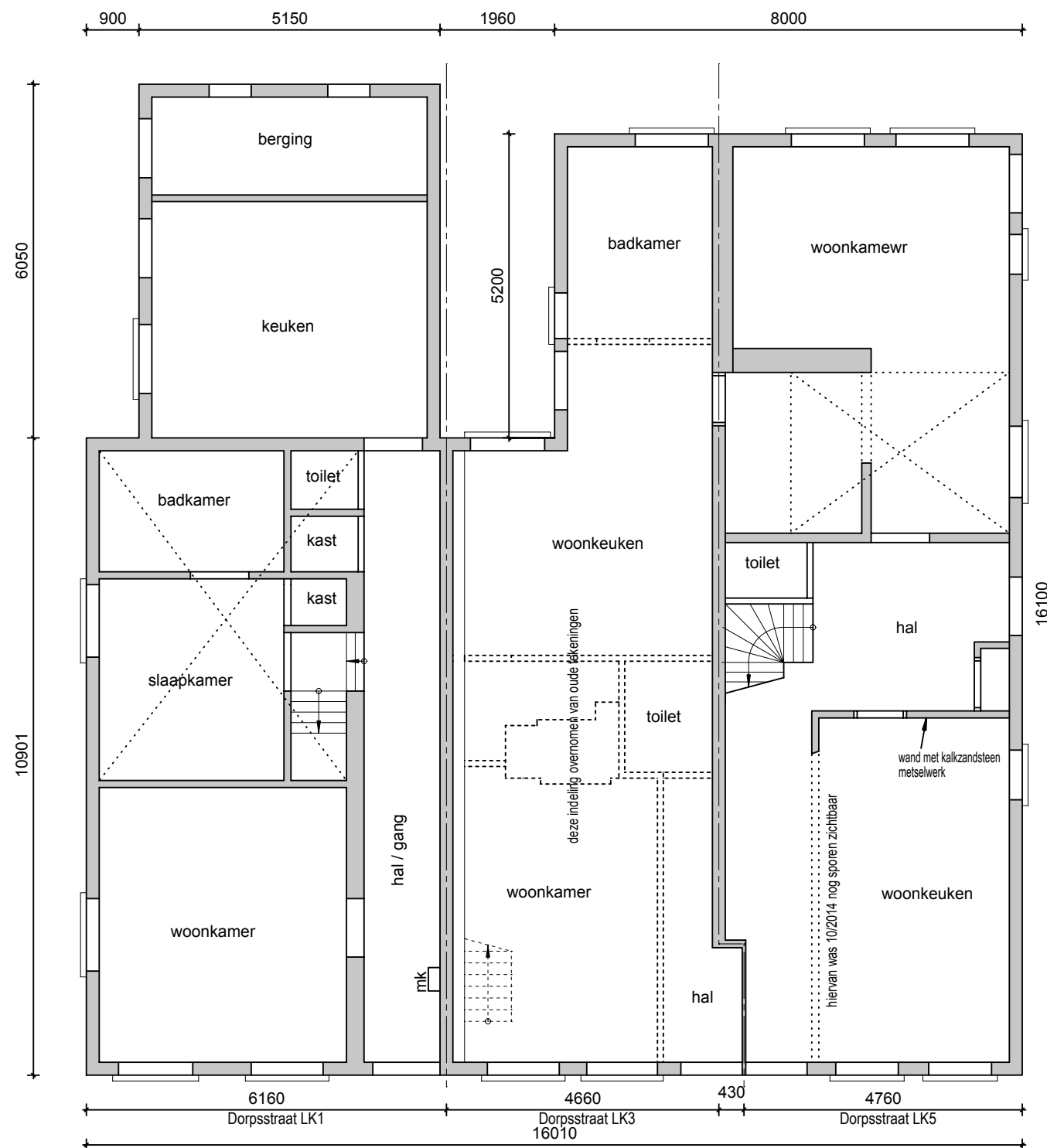
Begane Grond, bestaand

de indeling en benamingen van de ruimten is een inschatting; de binneninrichting is in het verleden al grotendeels verwijderd