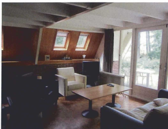
Interieur woning; geen asbest aangetroffen.