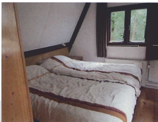
Slaapkamer op de verdieping; geen asbest aangetroffen.

Door de opdrachtgever zijn geen gegevens verstrekt met betrekking tot het voorkomen van asbesthoudende onderdelen die gebruikt konden worden voor deze inventarisatie. Gezien de duidelijkheid van de aangetroffen situatie was dit ook niet nodig. Wel is er toegang verschaft tot de te beoordelen locatie.