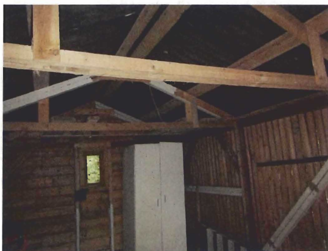
Interieur schuurtje/garage; geen asbest aangetroffen.