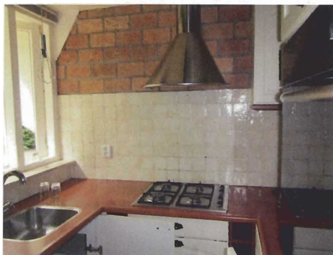
Keuken; geen asbest aangetroffen.

ter analyse is aangeboden aan een gecertificeerd laboratorium. Er zijn geen asbesthoudende of asbestverdachte onderdelen aangetroffen.