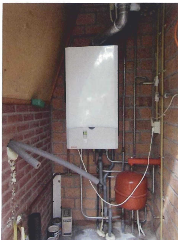
cv-installatie en leidingwerk; geen asbest aangetroffen.

In de recreatiewoning en het schuurtje/garage bij de woning zijn geen asbesthoudende of asbestverdachte onderdelen aangetroffen. Er zijn geen monsters ter analyse genomen (was geen aanleiding toe). De inventarisatie is uitgevoerd ter voorbereiding van de verkoop van de recreatiewoning aan de Roessinkweg 12 te Hengelo (Gld). Alle ruimten zijn als zodanig beoordeeld. Er heeft geen destructief onderzoek plaatsgevonden omdat hier geen aanleiding toe was.