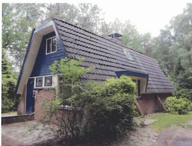
Recreatiewoning aan de Roessinkweg 12 te Hengelo (Gld).