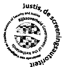
A.A.A.M. Huldy Afdelingsmanager COVOG

De Staatssecretaris van Veiligheid en Justitie, namens deze,