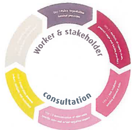
Figure 1: DD management system cycle of the AGT; Policy and Organisation, risk assessment, action plan, monitoring, review and communication

It takes time to affect change in supply chains via the process of due diligence. In the AGT it is assumed that after 3-5 years, steps of improvement could be achieved for those who are currently experiencing negative impacts. According to the expectations set in the Assessment framework 5 , companies that joined in July 2016 start implementing impact driven measures in the current implementation year (second action plan / 3 rd year). The AGT Steering Committee therefore feels it is too early to do a wide evaluation in production countries. However, through a qualitative evaluation of selected cases in one key production country part of this mid-term evaluation aims at evaluating this expectation/assumption, including key success or limiting factors. In this manner, the MTE is expected to assess whether the AGT is on the right track towards achieving its goals, and if any recommendations can be implemented to enhance the likely 'impact on the ground'. This also concerns the 9 thematic areas as specified in Annex I of the AGT. Similarly, results at impact level with regards to the 9 themes cannot be measured at this stage. It can however be evaluated to what extent the identified activities, strategies and (mid-term) goals as referred to in the annex of the AGT are being carried out successfully and whether these are indeed relevant in order to achieve impact in these areas.