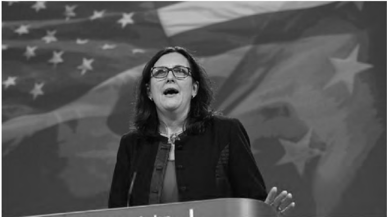
Europees Commissaris voor Handel Cecilia Malmström

Tweede Kamerleden, Europarlementariërs en ministeries hebben geen elektronische toegang meer tot de onderhandelingsdocumenten die over het handelsverdrag TTIP gaan.