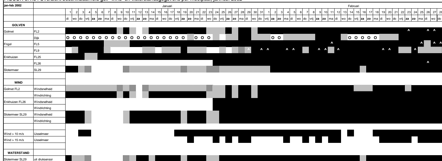
FIGUUR 3.1.d : Overzicht beschikbaarheid golf- wind- en waterstandsgegevens per meetpaal; jan./feb. 2002