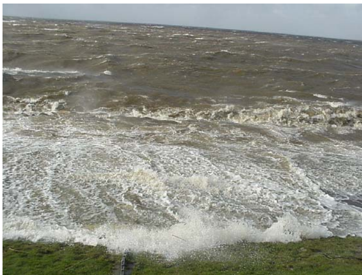
..... Foto 15 Golfoploop Rotterdamse Hoek; 26/2/2002, 13h MET; WZW windkracht 8 à 9.