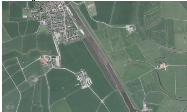
Figuur 3. Begrenzing van planlocatie 4 ten opzichte van Garnwerd.

Planlocatie 4 betreft een oeverzone gelegen direct ten zuiden van Garnwerd (zie figuur 3). Het traject is circa 600 meter lang en maximaal 5-10 meter breed. De breedte van de rietvegetatie varieert over het traject tussen de 1-10 meter. Hierin staat overwegend vegetatie als overjarig riet, harig wilgenroosje, oeverzegge, valeriaan, watermunt en opslag van gewone esdoorn. Het gebied wordt begraasd door melkkoeien.