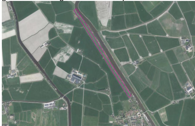
Figuur 2. Begrenzing van planlocatie 3 ten opzichte van Garnwerd.

Planlocatie 3 ligt ten noorden van Garnwerd en heeft een lengte van 1.300 meter (zie figuur 2). De breedte van de oeverzone is maximaal 5-10 meter landinwaarts. Op een aantal plekken in het traject, zijn vooroevers aanwezig met een ondiepe waterzone. De rietstrook varieert over de lengte van de planlocatie van ongeveer 2 – 10 meter. Tevens zijn er kleine delen waar rietvegetatie geheel ontbreekt. Ten zuiden van het traject is een koepelwilg aanwezig. De rietvegetatie wordt gedomineerd door 1-3-jarig riet, harig wilgenroosje, liesgras, speerdistel, waterbies. Ook staan er oppervlaktes met ruige vegetaties met kruiden als zegges, pitrus, ridderzuring, watermunt en egelskop in de oeverzone. In de vooroevers zijn ook enkele zwanenbloemen aanwezig. Het gebied wordt begraasd door schapen.