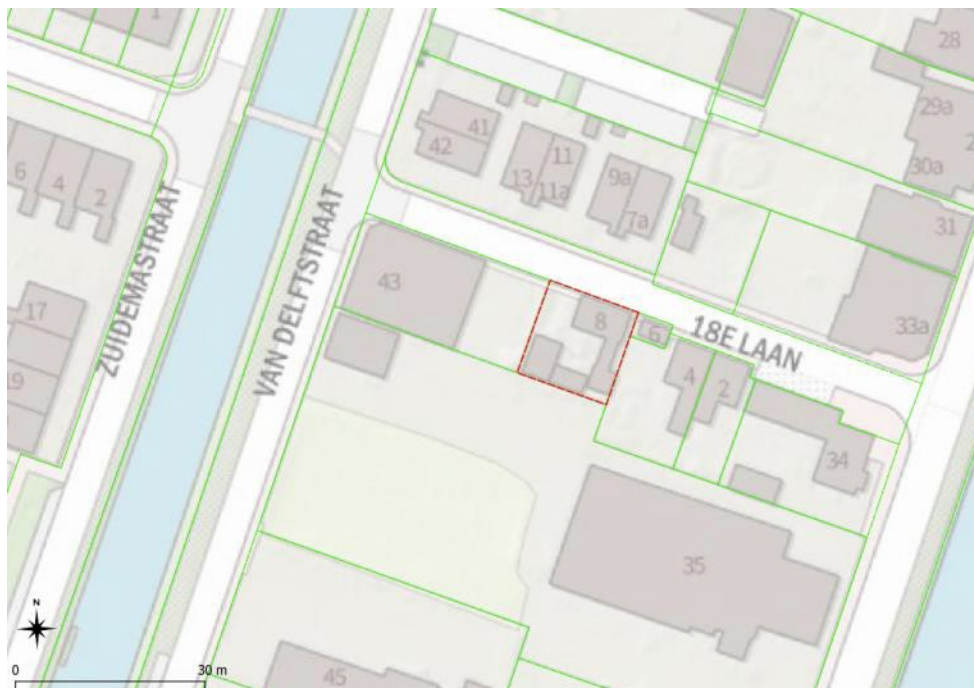
Figuur 1. Plangebied (rood omlijnd).