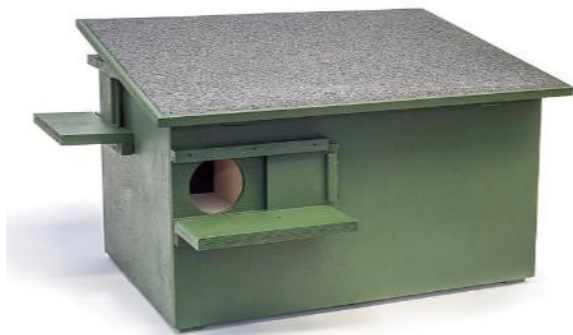
Figuur 3. ZK MA 01 Steen-/ boommarterkast (Vivara Pro).

Twee maanden voordat de gebouwen gesloopt worden, dienen er twee alternatieve verblijfplaatsen voor de steenmarter te worden gerealiseerd. De verblijfplaatsen worden gerealiseerd in de vorm van een steenmarterkast (zie figuur 3).