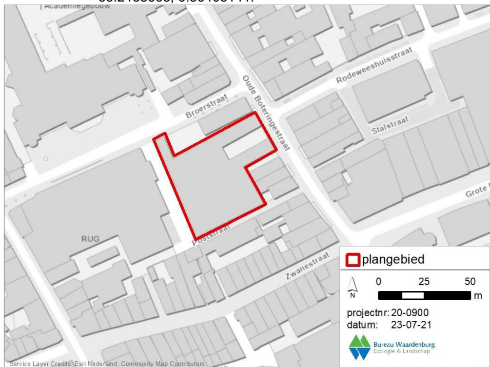
Figuur 1. Ligging plangebied (rood omkaderd). (Esri Nederland, Community Map Contributors | Esri Nederland, beeldmateriaal.nl | Esri Nederland, Kadaster | Esri Nederland, AHN)