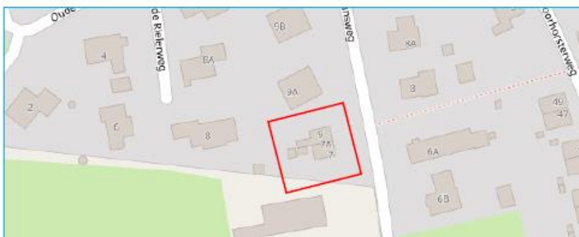
Afbeelding 2 en 3: Situering woningen Rielerenkweg en Kolkmansweg.