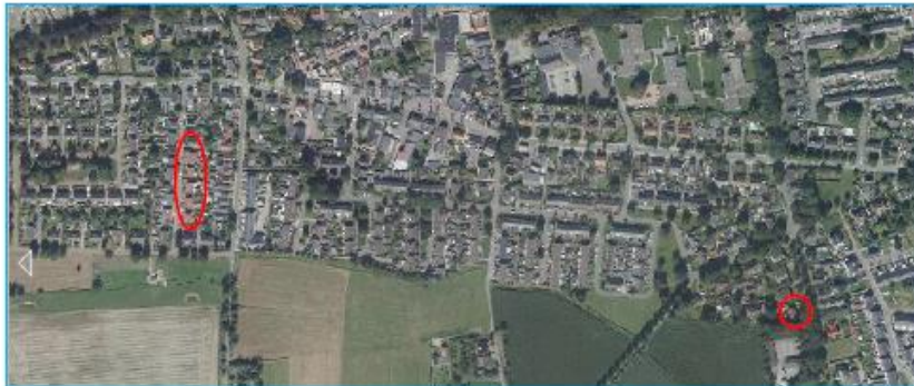
Afbeelding 1 Situering woningen Rielerenkweg en Kolkmansweg (bron: Atlas van Overijssel, luchtfoto 2016).