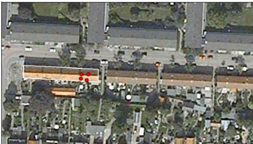
Figuur 3. Territoria / nesten van huismus ter plaatse van en direct rond de te renoveren woningen in Steenwijk.