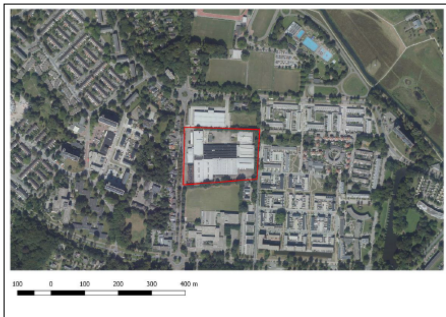
Luchtfoto met de ligging van het plangebied (rood omkaderd).