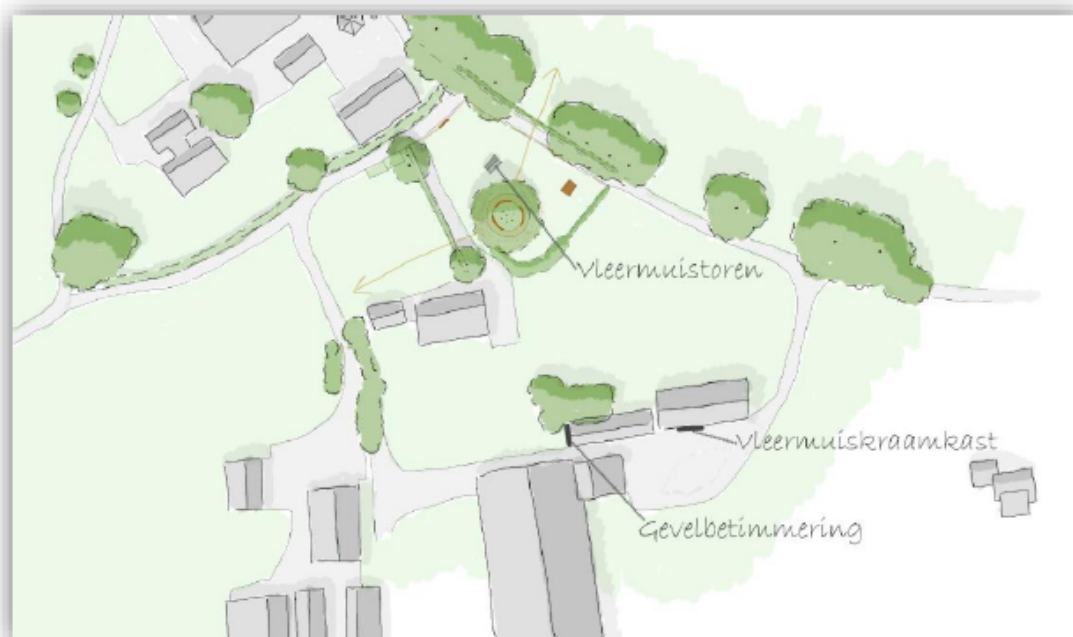
Figuur 5. Ligging van de vleermuisvoorzieningen. De vleermuistoren komt op de locatie van het voormalige erf nabij de ligging van de huidige verblijfplaats, de gevelbetimmering en de vleermuiskraamkast op het naastgelegen erf.

Voorafgaand aan de werkzaamheden worden als alternatief een vleermuistoren gebouwd, gevelbetimmering gerealiseerd en een kraamkast aangeboden. Deze worden in of in de directe omgeving van het plangebied geplaatst en gerealiseerd.