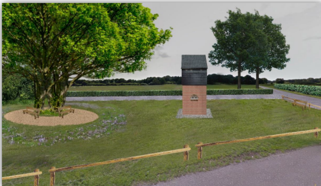
Figuur 7. Concept-sfeerimpressie van de nieuwe brink en de vleermuistoren.

Afhankelijk van de wensen van het dorp en welke mogelijkheden er zijn voor extra subsidie wordt de toren verder aangekleed;