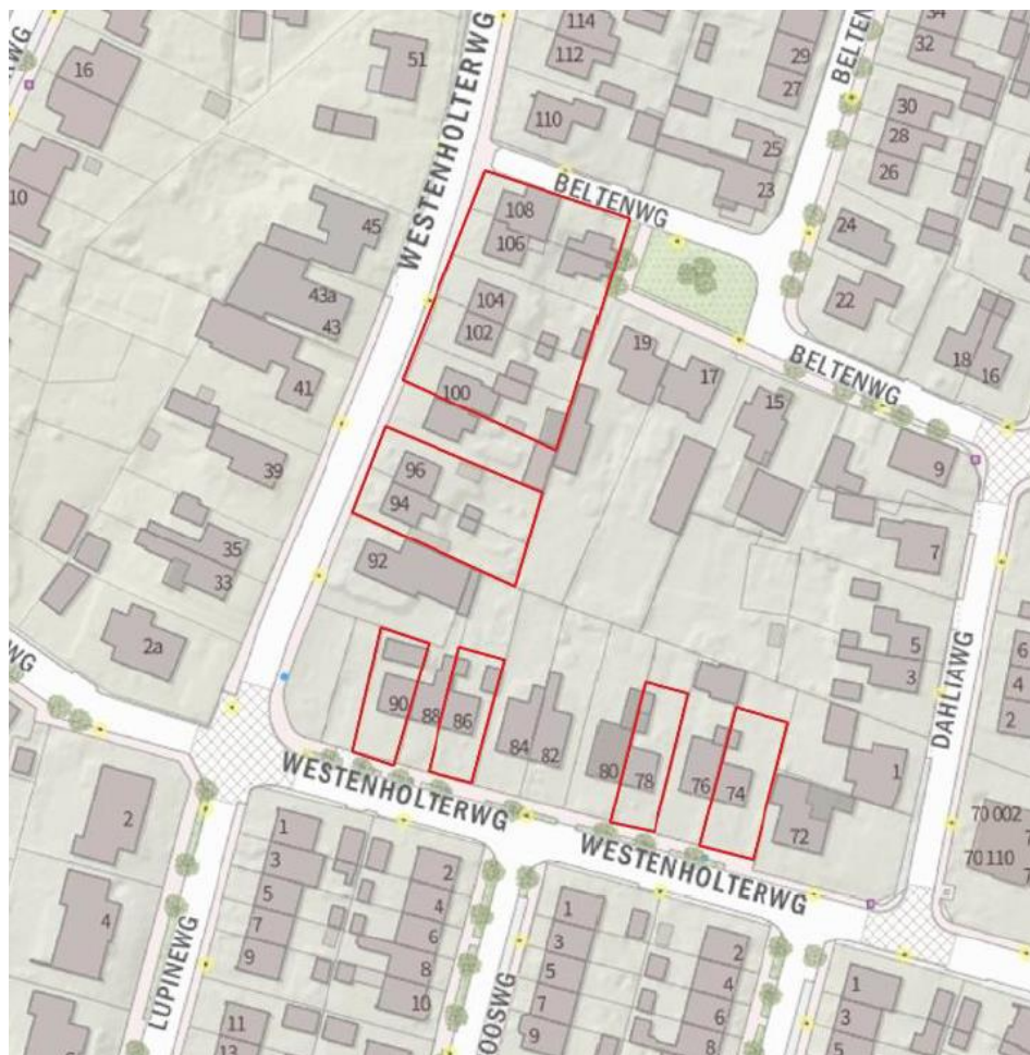
Figuur 1. Ligging van de te renoveren huizen (binnen rode contouren).

Het plangebied betreft 11 ééngezinswoningen (bouwjaar 1949-1950) aan de Westenholterweg te Zwolle. Het plangebied is gesitueerd in de westelijke hoek van Zwolle in de wijk Westenholte. DeltaWonen heeft het voornemen om haar woningen in 2020 te verduurzamen. Daarnaast is asbest aangetroffen in het dakbeschoot waardoor tevens asbestsanering zal plaatsvinden.