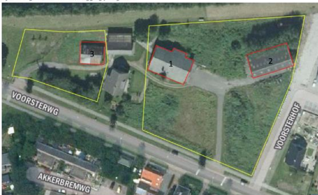
Afbeelding 2. Onderzoeklocatie. Planlocatie: geel, 1: voormalige houtzagerij, 2: kapschuur, 3. voormalige houtopslag