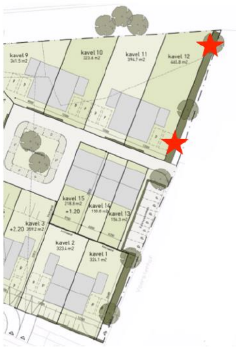
Afbeelding 5: Oostkant planlocatie. Rood: Permanente compensatie steenmarterkasten