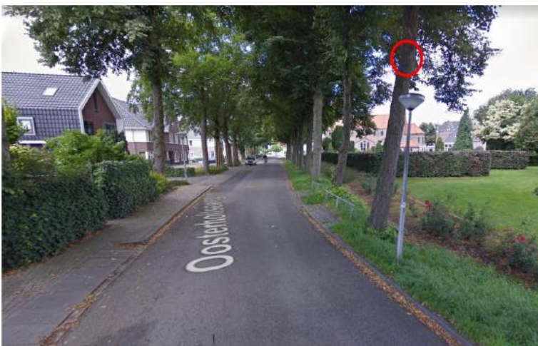
Figuur 12. Bomenrij waar vijftien vleermuiskasten worden geplaatst. De rode cirkel geeft een indicatie van de hoogte van de te plaatsen vleermuiskasten.