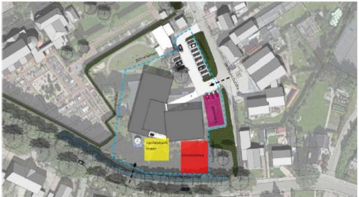
Figuur 2. Locatie van kraan, bouwopslag en bouwkeet ten opzichte van het nieuw te bouwen gebouw en groenelementen.