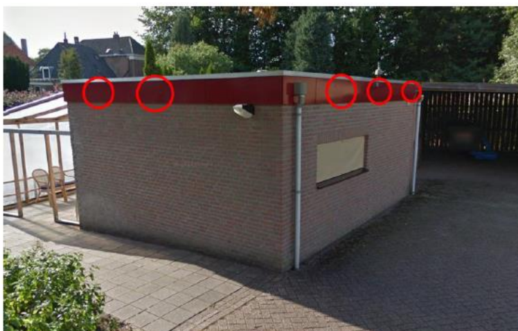
Figuur 11. Locaties waar kasten geplaatst worden op het bijgebouw.