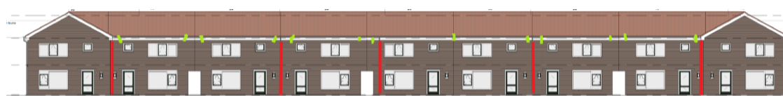
Vooraanzicht gerenoveerde woningen Dahliastaat met de nieuwe voorzieningen voor de huismus. In het groen de invliegopeningen (diameter 35mm). In het rood zijn de regenpijpen weergegeven.