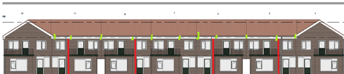
Achteraanzicht gerenoveerde woningen Geraniumstraat met de nieuwe voorzieningen voor de huismus. In het groen de invliegopeningen (diameter 35mm). In het rood zijn de regenpijpen weergegeven.