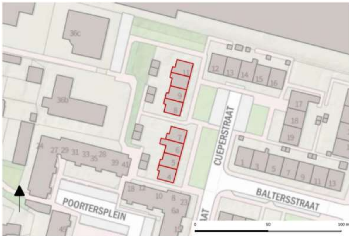
Plangebied (rood omlijnd).

De voorgenomen werkzaamheden aan de twee blokken worden gefaseerd in de tijd uitgevoerd, met een overlap in de werkperiode. De werkzaamheden aan het eerste blok starten begin oktober 2020 en aan het tweede blok begin november 2020. De duur van de werkzaamheden is tien weken per blok. Naar verwachting zijn de werkzaamheden uiterlijk 26 februari 2021 gereed.