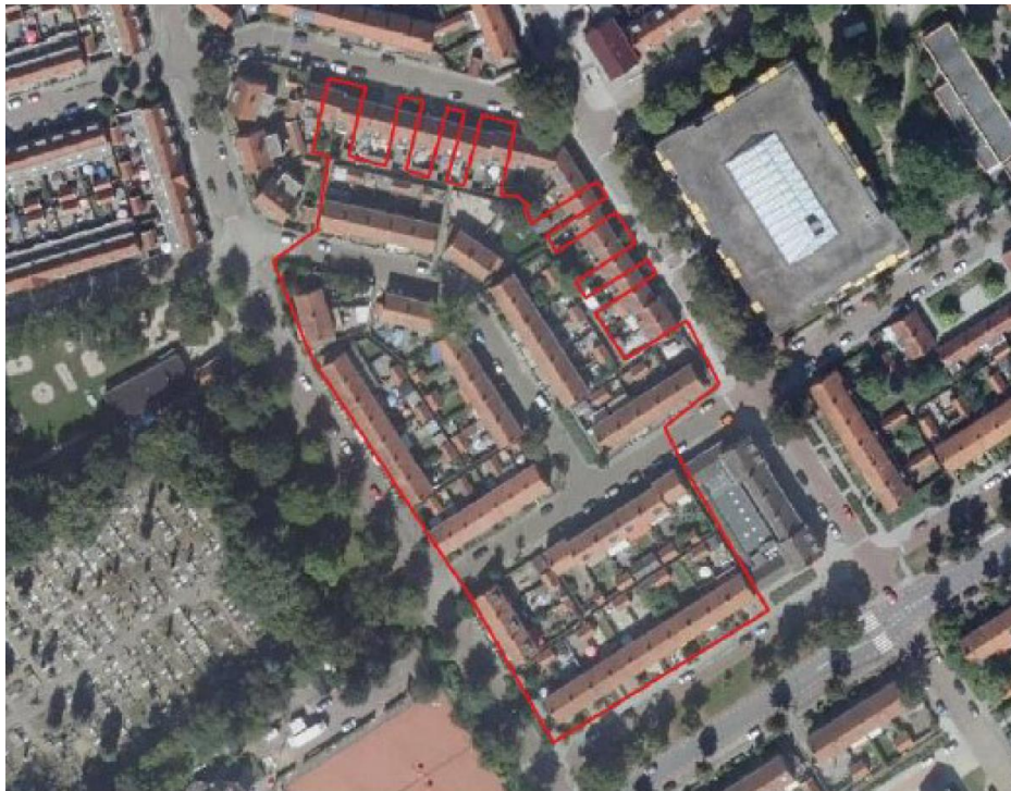
Figuur 1. Ligging plangebied.

De aanvrager, Ieder1 heeft het voornemen om de locatie op korte termijn te renoveren en energiearm te maken. De renovatie bestaat uit het isoleren van spouwmuuren en het isoleren van daken.