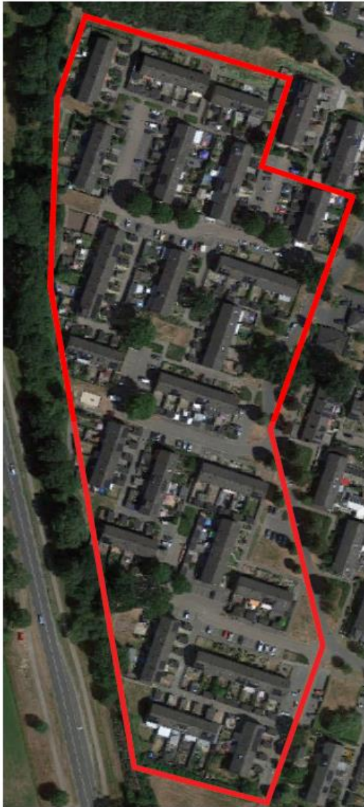
Ligging van het projectgebied