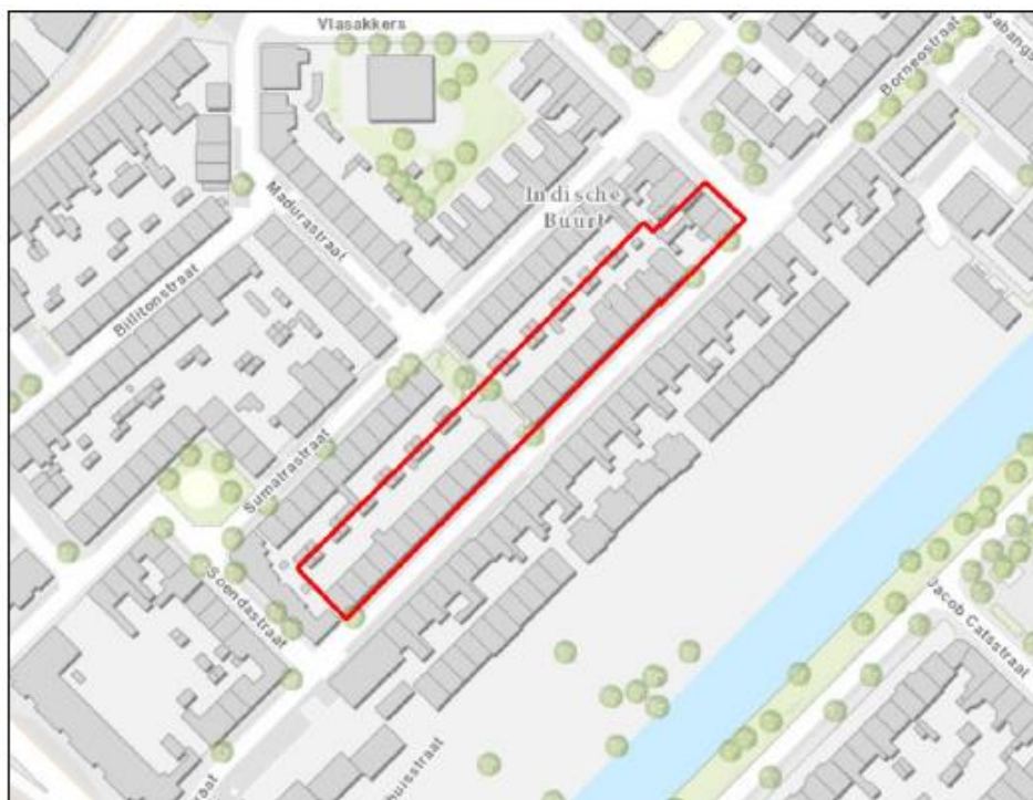
Figuur 1.2 De ligging van het projectgebied complex 45. Kaartondergrond: ESRI Nederland.