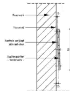
Figuur B5.1: Voorbeeld kleine gevelbetimmering, aan te brengen in de nok van de kopgevel.

Het aanbrengen van klein oppervlak gevelbetimmering is een goede optie voor kleine verblijfplaatsen van alle vleermuizen (zie figuur B5.1). Alleen tijdens langdurige vorstperioden zijn dergelijke verblijfplaatsen minder geschikt. De kleine gevelbetimmering is in feite een grote vleermuiskast die in de nok van de kopgevel wordt bevestigd (hoogte vanaf de nok is minimaal 50 centimeter). Vleermuizen vliegen aan de onderzijde in en kunnen zo naar boven kruipen. Vooral de zuid- en westgevels zijn geschikt, vanwege de warmte van de middag- en avondzon. Enige variatie tussen de windrichtingen van gevels waar gevelbetimmering wordt aangebracht, is overigens wel gewenst. Verschillende windrichtingen geven ook verschillende microklimaten, die meer keuzemogelijkheden voor vleermuizen bieden.