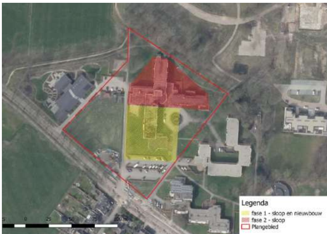
Figuur 1. Plangebied met fasering sloop.