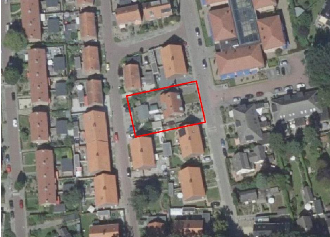
Figuur 1. Ligging plangebied, Draaiomsweg 9 en 11.