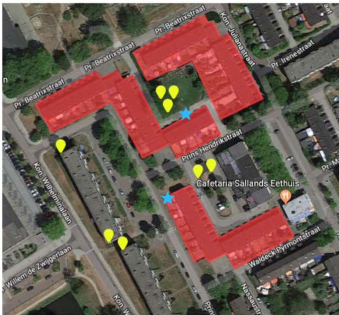
Planlocatie (rood), zomerverblijfplaatsen (blauw), vleermuiskasten (geel)