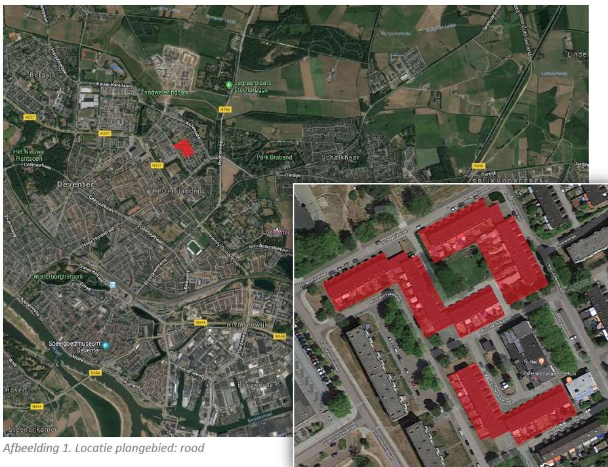
Afbeelding 1. Locatie plangebied: rood

Het plangebied is geheel gelegen aan de noordkant van de bebouwde kom van de gemeente Deventer, zie onderstaande figuur. Het onderzoeksgebied betreft 54 woningen verspreid over 7 woonblokken. Zowel aan de voor- als aan de achterzijde van de bebouwing zijn tuinen aanwezig. In de achtertuinen staan op de grens van het plangebied diverse bergingen.