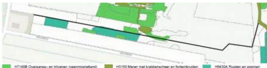
Figuur 1. Toekomstig tracé watergang en aanwezige kwalificerende habitattypen op basis van de habitattypekaart in Atlas van Overijssel 2020.

Volgens de habitattypekaart van de provincie Overijssel 14 grenst de nieuwe watergang aan het habitatype 'H6430A Ruigten en zomen (met Moerasspirea)' en doorkruist het tracé het habitatype 'H7140B Overgangs- en trilvenen (veenmosrietland)' (zie figuur 1). Het habitatype 'H3150 Meren met krabbenscheer en fonteinkruiden' ligt op ruime afstand van dit tracé.