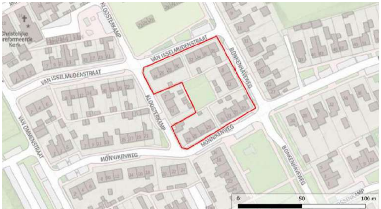
Figuur 1. Te slopen woningen in Sint Jansklooster

Deze woningen worden geheel gesloopt, vanaf maart-april 2021. Als vervanging worden nieuwe woningen op deze locatie gerealiseerd. Een concrete planning of ontwerp voor de nieuwbouw is nog niet gereed.