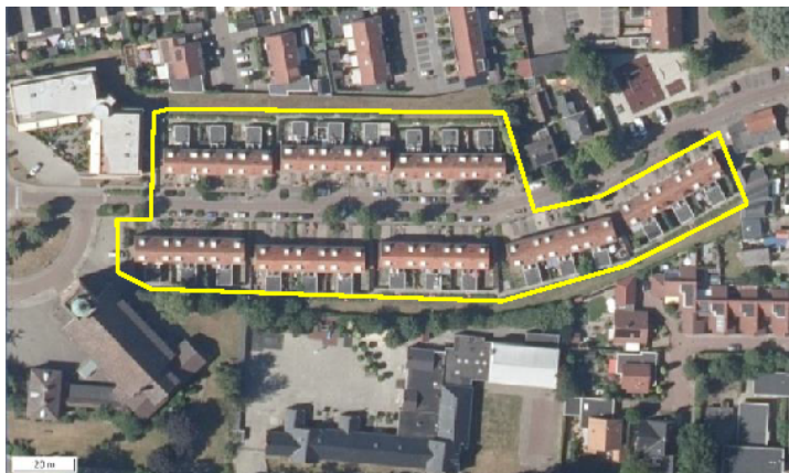
Detailopname en begrenzing van het plangebied. De begrenzing van het plangebied wordt met de gele lijn aangeduid.