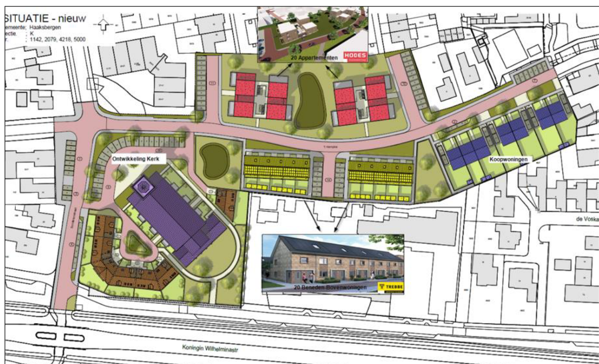
Verbeelding van het wenselijke eindbeeld.

Het project wordt in 3 fasen uitgevoerd in 2021, 2022 en 2023. Zie bijlage 3 voor de planning van de werkzaamheden per blok in elke fase.