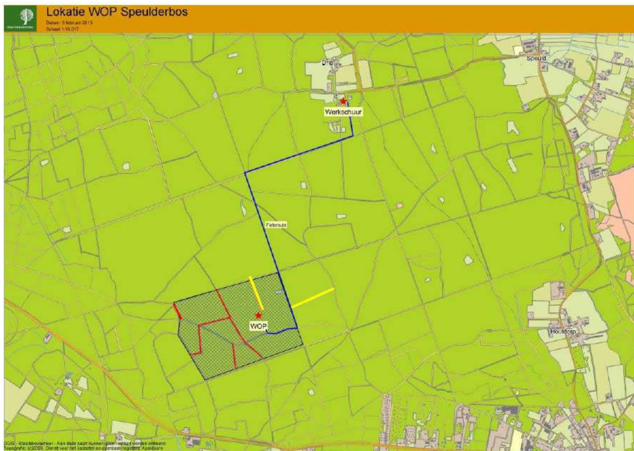
Figuur 1. Geplande locatie WOP Speulderbos (zuidelijke rode ster), geplande fietsroute (blauwe lijn) van de werkschuur (noordelijke rode ster) naar de WOP en paden die afgesloten zullen worden voor publiek (rode lijnen) en die reeds afgesloten zijn (gele lijnen).

Kaart van het gebied waarop locatie wildobservatiepunt is aangegeven