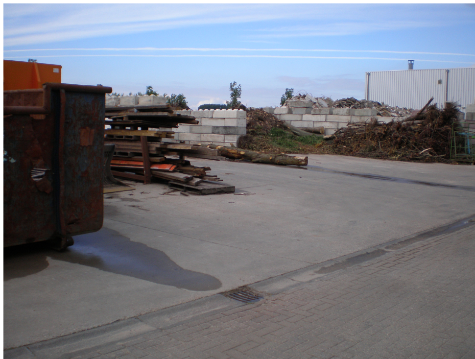
Foto 3: Opslag van afvalstoffen, rechts op de foto het ongebroken puin op het noordwestelijke terreindeel

Over de volle lengte van de westelijke perceelsgrens en deels langs de zuidwestzijde van het perceel staan keerwanden, zie onderstaande foto's 4, 5 en 6. Een gedeelte van het open terrein wordt gebruikt voor opslag van afvalstoffen, losgestort in vakken met keerwanden of in containers. en stalling van materieel. Daarnaast worden bouwgrondstoffen opgeslagen, zoals zand, grind en split.