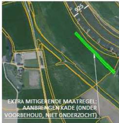
Figuur Extra maatregel Zutphen Links