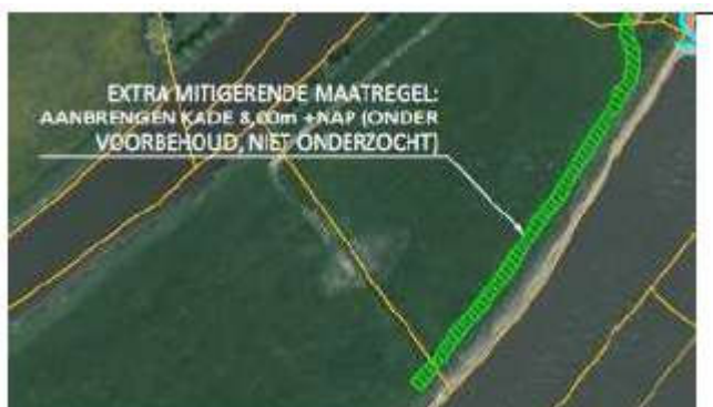
Figuur Extra maatregel Gelderse Toren