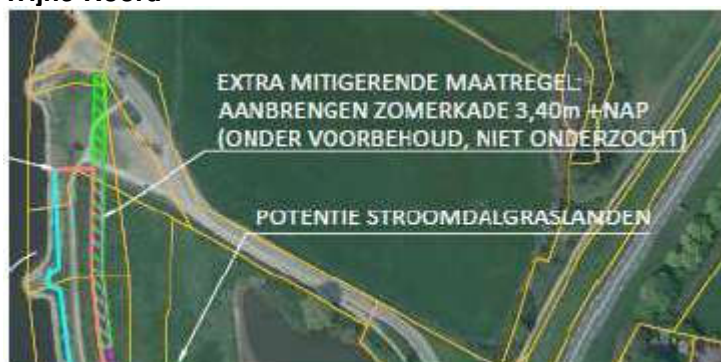
Figuur Extra maatregel Wijhe Noord