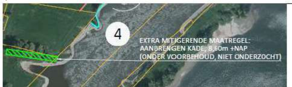
Figuur Extra maatregel Spankerense weilanden