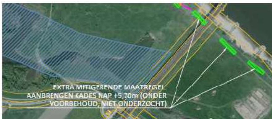
Figuur Extra maatregel Ossenwaard