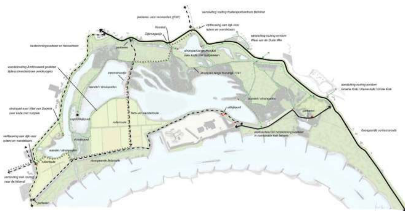
Figuur 1. Recreatieve ontsluiting Bemmelse Waard (Emond & Lensink, 2015).