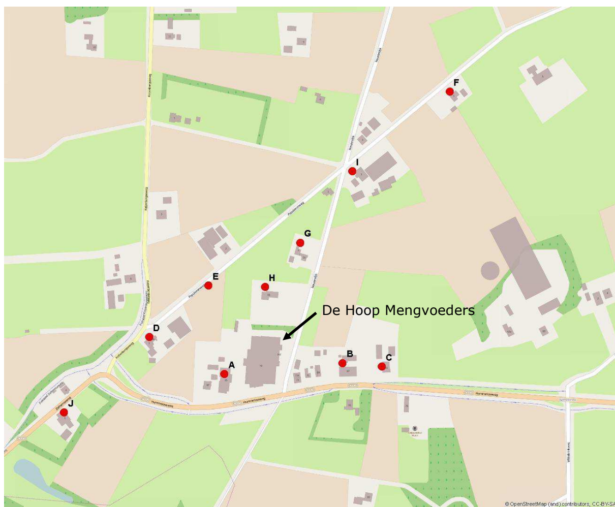
Figuur 1 Locaties van het bedrijf en de receptorpunten, locatie K staat niet op de kaart. Deze locatie ligt in Velswijk, ten noordoosten van het bedrijf.

De Hoop Mengvoeders is gevestigd aan de Hummeloseweg 85 in Zelhem. In figuur 3.1 wordt de ligging van het bedrijf gegeven met daarbij de receptorpunten waarop de concentratie van fijn stof en \text{NO}_2 berekend is. De Amersfoortse coördinaten van de receptorpunten zijn te vinden in tabel 3.1. Het luchtkwaliteitsonderzoek heeft betrekking op alle activiteiten die op het bedrijfsterrein plaatsvinden en waar mogelijk emissie van \text{NO}_x en/of \text{PM}_{10} voorkomt. De werkzaamheden binnen de inrichting vinden plaats van zondag 22:00 uur tot en met zaterdag 22:00 uur. Er is gerekend met een totale productietijd van 7488 uur per jaar, dit is zonder omsteltijd van de perslijnen.