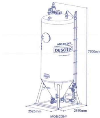
Figuur 2.1 Actief koolfilter (DESOTEC)

In onderstaande figuur 2.2 is de positionering van het actief koolfilter ten opzichte van de gehele inrichting weergegeven. Het actief koolfilter met de daarbij behorende containerunit wordt geplaatst naast het tank- en pompenlokaal aan de noordzijde van de inrichting.