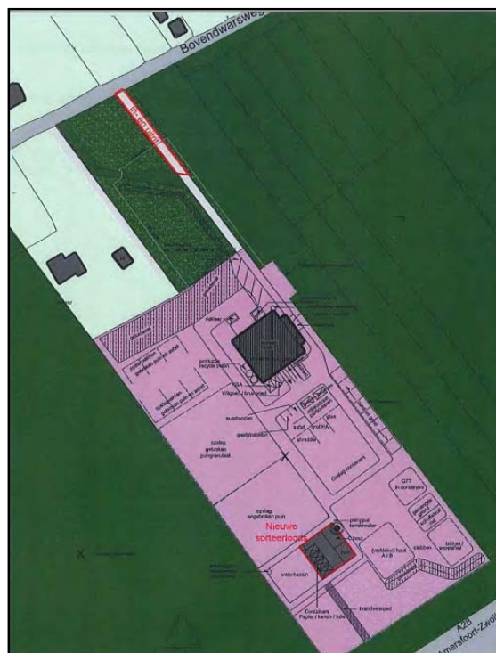
Afbeelding 2: Voorgenomen situatie met verlegde ontsluitingsweg en verplaatsing locatie op- en overslag van huishoudelijk afval