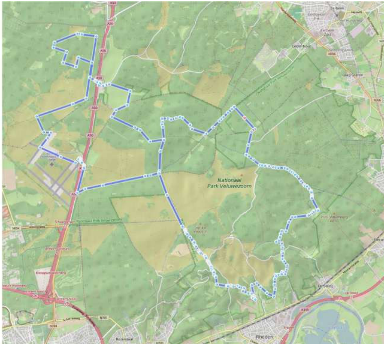
BIJLAGE 2 Kaart wandelroute (2 weergaven)